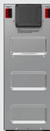
BLACK TT Plus 6-10K EBM