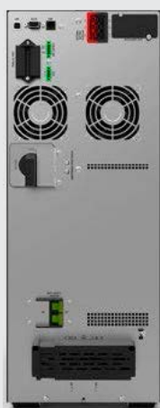
BLACK TT Plus 6K