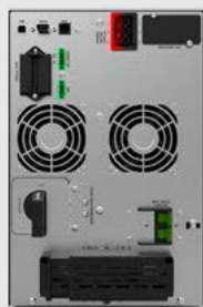
BLACK TT Plus 6K XL