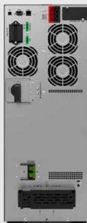
BLACK TT Plus 10K