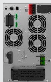
BLACK TT Plus 10K XL