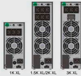
BLACK TT Plus 1-3K XL (IEC)