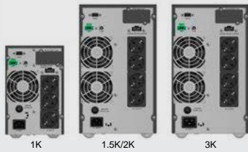
BLACK TT Plus 1-3K (SCHUKO)