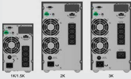
BLACK TT Plus 1-3K con RS232 (IEC)