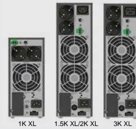
BLACK TT Plus 1-3K XL (SCHUKO)